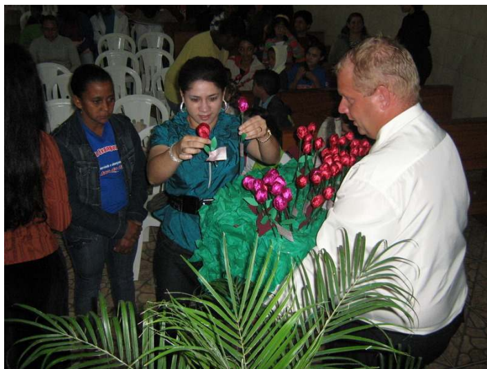
De rozen, met een bonbon erin, worden uitgedeeld aan de moeders.