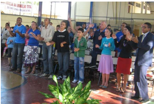
Tijdens de dienst op zondagmorgen in de sporthal in Merçes.

Ongeveer 10 mensen besloten om Jezus toe te laten in hun hart en leven en als Verlosser van hun ziel. Het Woord was ook erg fijn en duidelijk. Een fijne gelegenheid voor Evangelisatie en contacten met andere christenen en kerken.