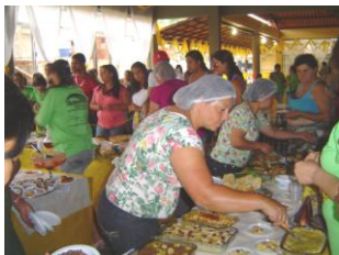
De dames hebben mutsjes op tijdens het verkopen van de lekkernijen

Op 24 november was er weer het jaarlijkse bananenfeest in ons stadje. Wij wonen hier in een gebied waar veel bananen groeien, het klimaat hier is daar bij uitstek geschikt voor. Vochtig en warm.