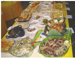
Hier ziet u een van de drie tafels met lekkernijen waarin bananen verwerkt zijn