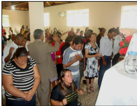
Na afloop van de dienst zijn er velen die gebed vragen

De maandagavonden hebben we altijd de repetitie van het zanggroepje van de Levieten en ook de kinderen hebben dan hun repetitie voor het dansgroepje. Sinds kort zijn we nu begonnen om na afloop van de repetitie een bidstond te houden voor allerlei onderwerpen van de Gemeente. Het is heel belangrijk om het werk van de Heer en de Gemeente in gebed te brengen! Zelfs is het belangrijk om te bidden dat er meer mensen komen om samen te bidden.