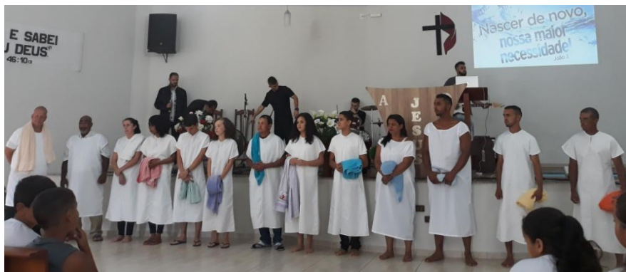
Doopdienst in Santa Bárbara do Tugúrio met 11 kandidaten