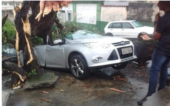
Auto geraakt door omgewaaide boom in Mercês

Ik wil u graag vertellen over Gods bescherming die we elk jaar weer mogen ervaren in dit moeilijke en gevaarlijke seizoen in Brazilië, de regen tijd. Misschien zit u wel eens iets er over op het nieuws. Elk jaar opnieuw hebben we te maken met