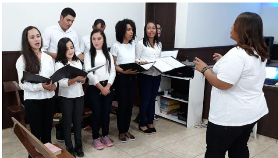
Jaarfeest zanggroep Semear