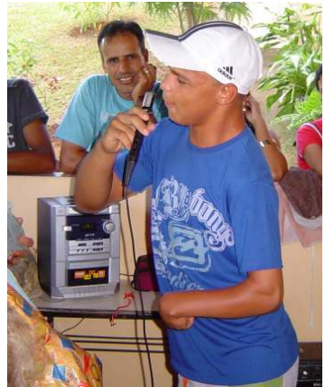
Het spel van de geheime vriend.

door gegeven. Het is erg gezellig en er wordt veel gelachen. Ook was er toen een barbecue, maar ieder moet zelf vlees en frisdrank meenemen.