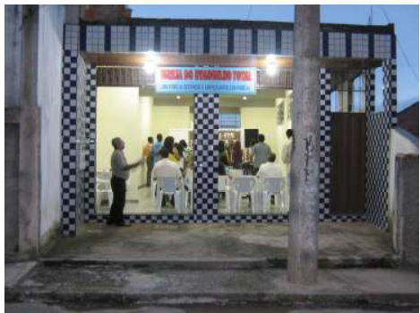
De zaal in Barbacena

In Barbacena, de wijk waar we de zaal van onze diensten hebben gehuurd is veel spiritisme en de mensen zijn daar nog niet erg open voor het Evangelie. Echt anders dan in Merçes waar de Gemeente snel groeit. In Barbacena moet hard gewerkt worden, deur aan deur evangelisatie en bezoeken brengen aan mensen. Daar gaat dit jaar hard aan ge-