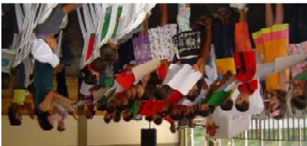
Tijdens de kerstdienst zongen de kinderen.

Op 23 december hadden we gezamenlijk ons Kerstfeest met het opvangcentrum en kerken samen. De kinderen van het opvangcentrum mochten hun ouders, broertjes en zusjes meenemen. Broertjes en zusjes tot 12 jaar kregen na afloop een cadeautje.