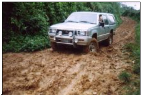
De "modderweg" naast de crèche zal nu spoedig tot het verleden behoren.