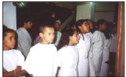
Enkele tieners van de crèche die vol overgave zingen tijdens het kerstfeest.

Graag willen wij u nog even iets vertellen van het Kerstfeest van 2003. Wij mochten de Lagere School lenen omdat de grote zaal die in de crèche gebouwd wordt, niet op tijd klaar kon zijn. Wij zien terug op een gezegend Kerstfeest. Veel meer mensen dan in andere jaren waren aanwezig, waaronder ook de vice-burgemeester, de directrice van de school e.a.