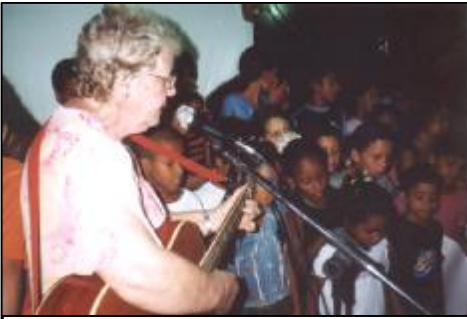
Ook de kleinere kinderen van de crèche zingen tot eer van God tijdens het kerstfeest

Door zang, kerststukjes door de kinderen van de crèche opgevoerd, prediking, een heerlijke liefdemaaltijd en cadeautjes voor 140 kinderen, mochten we weer de liefde van God laten zien. Wij zaaien en God zal op Zijn tijd de wasdom geven. Er was héél veel werk te doen, maar wat een blijdschap en voldoening als we terug mogen zien. Machtig is het te weten dat Jezus op deze aarde kwam om het verlorene te zoeken en te redden (Lucas 19:10).